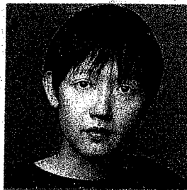
● Celine Song (36 anni) è una regista e drammaturga sudcoreana naturalizzata canadese. «Past Lives» è il suo primo film